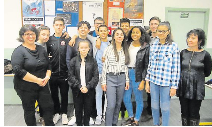
Quelques-uns des élèves et leurs professeurs ont présenté leurs travaux aux partenaires de cette association.

Quatre collègues choletais ont pu bénéficier d'un accès à la culture théâtrale, grâce à leurs partenaires.