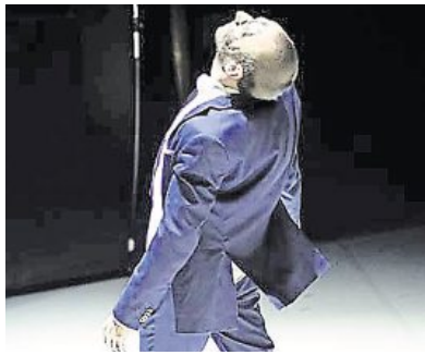
Le chorégraphe Yvann Alexandre.

Le noir est couleurs et nuances, encre profonde nourrissant son écriture pour ces soli qui signent une obsession du noir, synonyme de perfection. Obsession du solo aussi, comme une forme malléable et fluide, toujours renouvelée par la plasticité des corps, par leur adéquation à une direction lisible et fluide, par leurs identités mêlées dans un langage clair et habité du mouve-