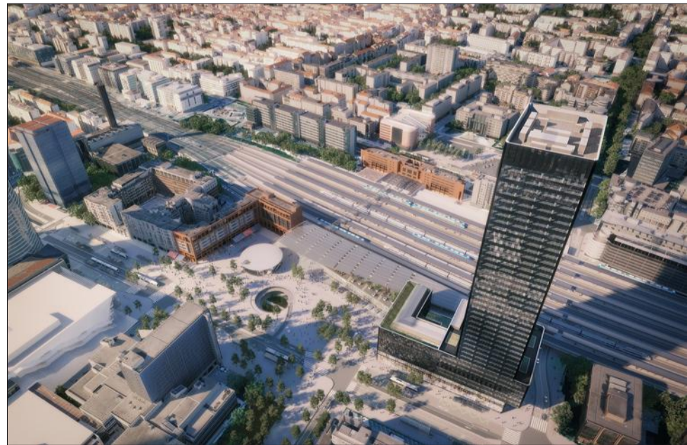
La tour To Lyon et la future place Béraudier.

Encore en service, mais réduite à une voie de circula-